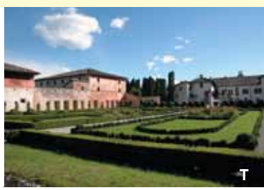
936° dello Stato Patriarcale