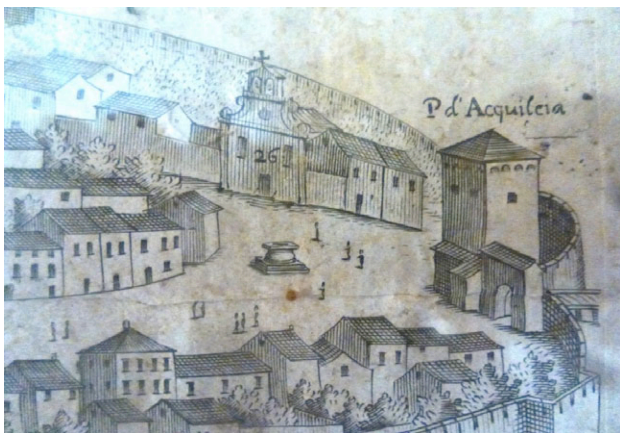
Gazoldi, Cosattino, Ruffoni - 1661

La Torre di Porta Aquileia, di proprietà comunale, fa parte della quinta ed ultima cortina muraria eretta a difesa della città tra il 1330 e il 1440 racchiudendo in sé tutto l'abitato con una cerchia di 7.117 metri lineari complessivi e la costruzione di nove nuove porte, tra cui porta Aquileia. Essa con Porta Villalta, è l'unica superstite delle tredici porte che collegavano la città con gli assi viari e commerciali più importanti. Nel 1850 esisteva ancora tutta la quinta cinta esterna con 9 torri portaie e ben 32 torri scudate. Con il 1852 la Torre viene giudicata inservibile e abbandonata. Tra il 1870 e 1918 vengono demolite tutte le porte assieme alla cerchia muraria e relative torri scudate, escluse le due porte citate.