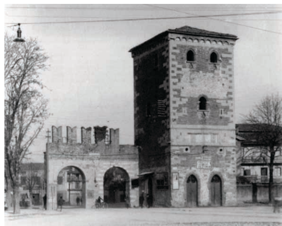
Torre di Porta Aquileia – 1920 ca.

Torre medievale di Porta Aquileia a Udine