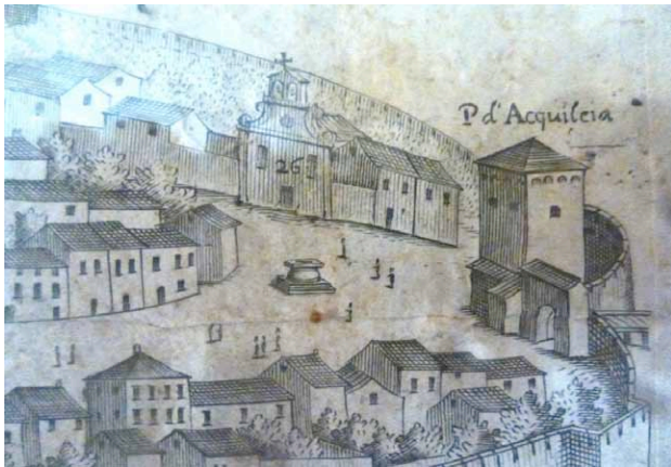
piazza del pozzo - Gazoldi, Cosattino, Ruffoni - 1661

La Torre di Porta Aquileia, di proprietà del comune di Udine, fa parte della quinta ed ultima muraria eretta a difesa della città tra il 1330, in parte durante il patriarcato di Bertrando, e il 1440 racchiudendo in sé tutto l'abitato con una cerchia di 7.117 metri complessivi e la costruzione di nove nuove porte, tra cui porta Aquileia. Essa con Porta Villalta, è l'unica superstite delle tredici porte che collegavano la città con gli assi viari e commerciali più importanti. Nel 1850 esisteva ancora tutta la quinta cinta esterna con 9 torri portaie e ben 32 torri scudate. Con il 1852 la Torre viene giudicata inservibile e abbandonata. Tra il 1870 e 1918 vengono demolite tutte le porte assieme alla cerchia muraria e relative torri scudate, escluse le due porte citate (delle cinte precedenti rimangono la torre di Santa Maria e di San Bartolomeo).