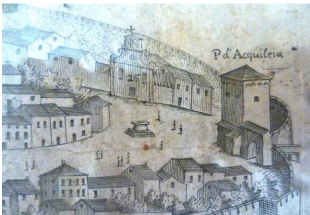
piazza del pozzo - Gazoldi, Cosattino, Ruffoni - 1661

La Torre di Porta Aquileia, di proprietà del comune di Udine, fa parte della quinta ed ultima muraria eretta a difesa della città tra il 1330, in parte durante il patriarcato di Bertrando, e il 1440 racchiudendo in sé tutto l'abitato con una cerchia di 7.117 metri complessivi e la costruzione di nove nuove porte, tra cui porta Aquileia. Essa con Porta Villalta, è l'unica superstite delle tredici porte che collegavano la città con gli assi viari e commerciali più importanti. Nel 1850 esisteva ancora tutta la quinta cinta esterna con 9 torri portaie e ben 32 torri scudate. Con il 1852 la Torre viene giudicata inservibile e abbandonata. Tra il 1870 e 1918 vengono demolite tutte le porte assieme alla cerchia muraria e relative torri scudate, escluse le due porte citate (delle cinte precedenti rimangono la torre di Santa Maria e di San Bartolomeo).