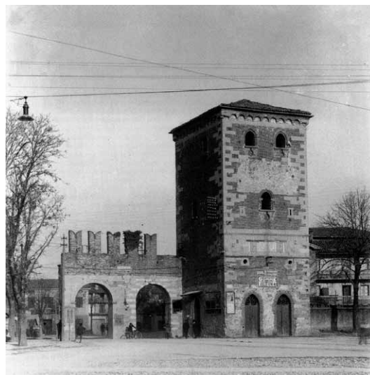
Torre di Porta Aquileia – 1920 ca.