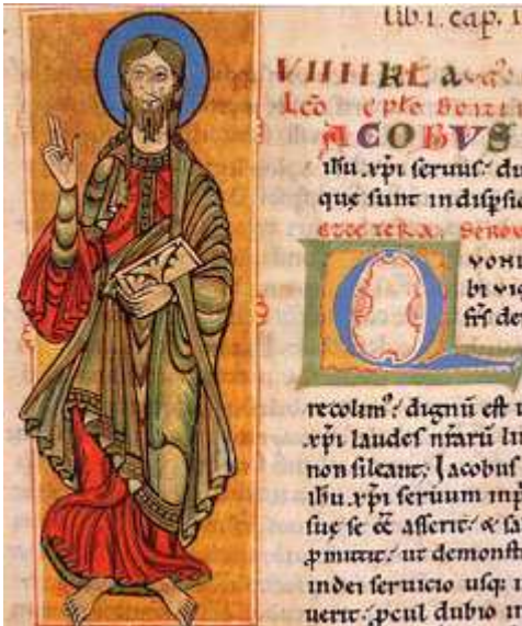
S.Giacomo - miniatura del codice callistino A.D. 1140