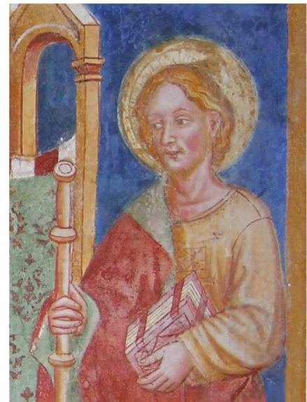
Madonna di Zucco – S.Giacomo affresco XIV° sec.