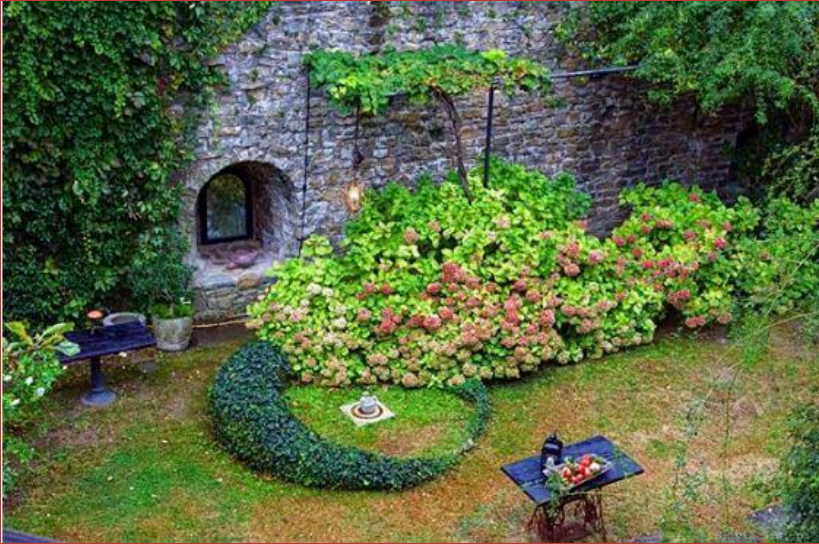
CASTELLO DI MUGGIA