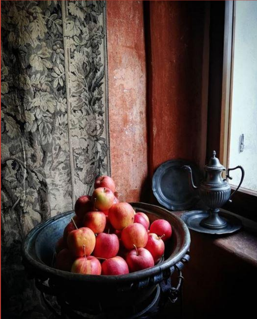
@stefania.girotto CASAFORTE LA BRUNELDE