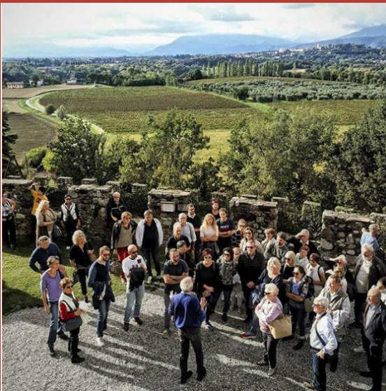
@viacantoni_13 CASTELLO DI ARCANO