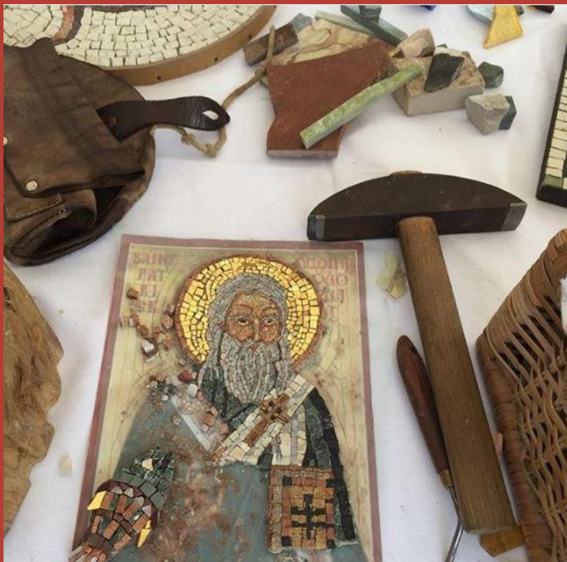
@franca.boiago CASTELLO FORMENTINI