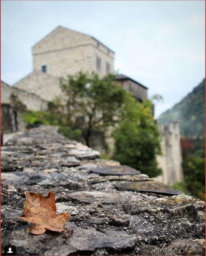
@jade CASTELLO DI SAN PIETRO DI RAGOGNA