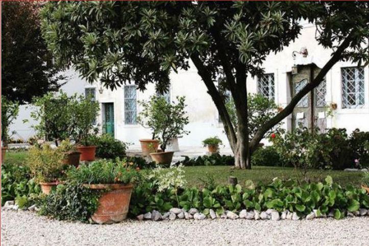
@turismo_culturale@ PALAZZO STEFFANEO RONCATO