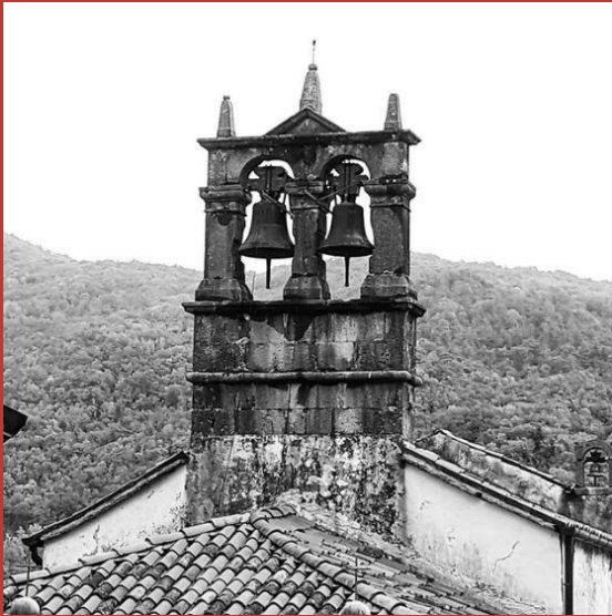
@csandra_cs CASTELLO DI AHRENSBERG