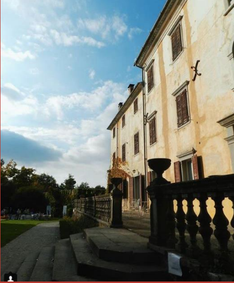
@mascherataesulonessi CASTELLO DI FLAMBRUZZO