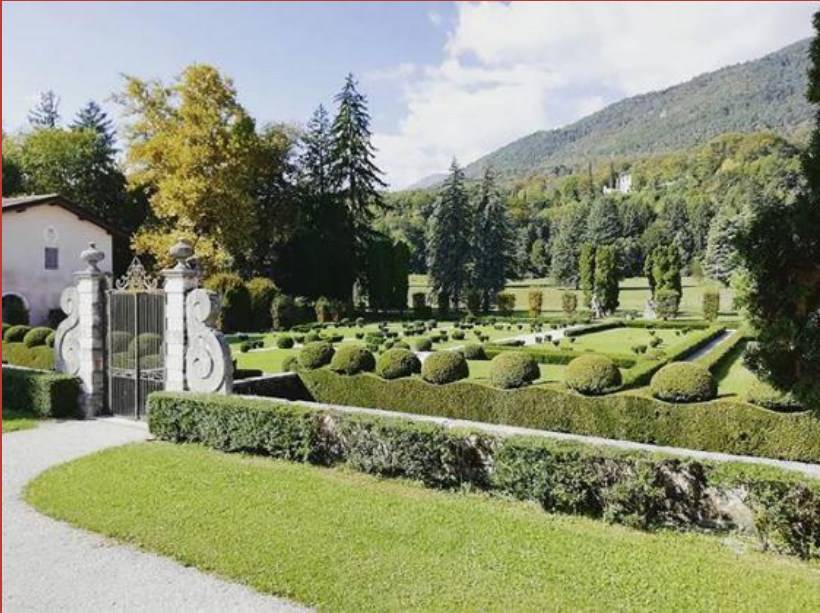
@bieffe PALAZZO d'ATTIMIS MANIAGO