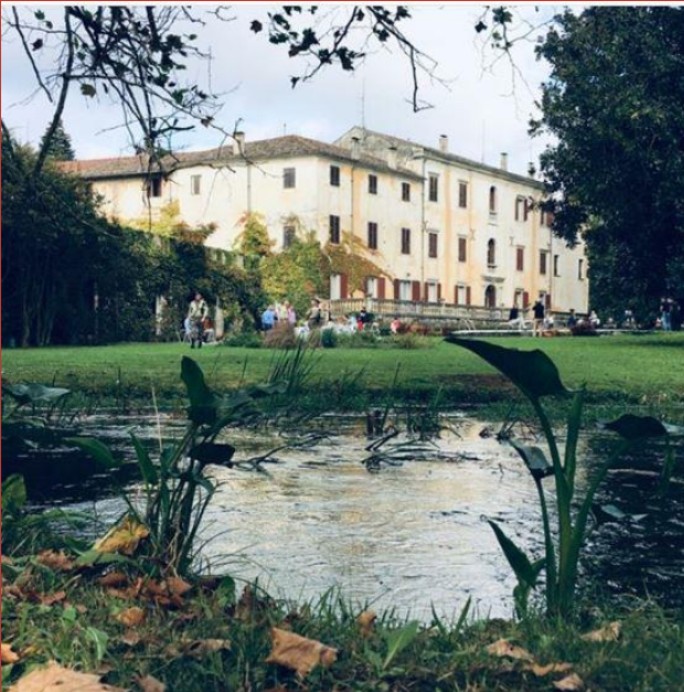
@sarapiera19 CASTELLO DI FLAMBRUZZO