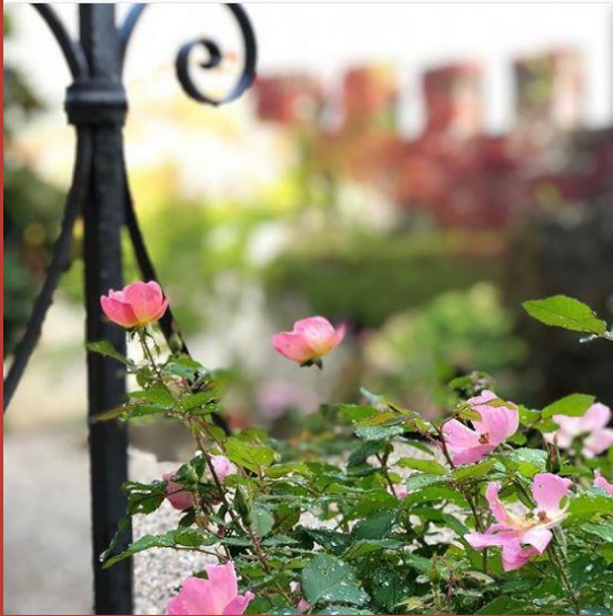
@vale_more1491 CASTELLO DI ARCANO