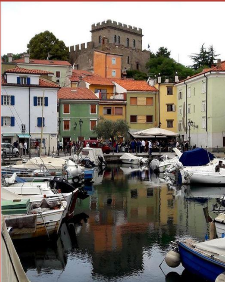
@morrismauri CASTELLO DI MUGLIA